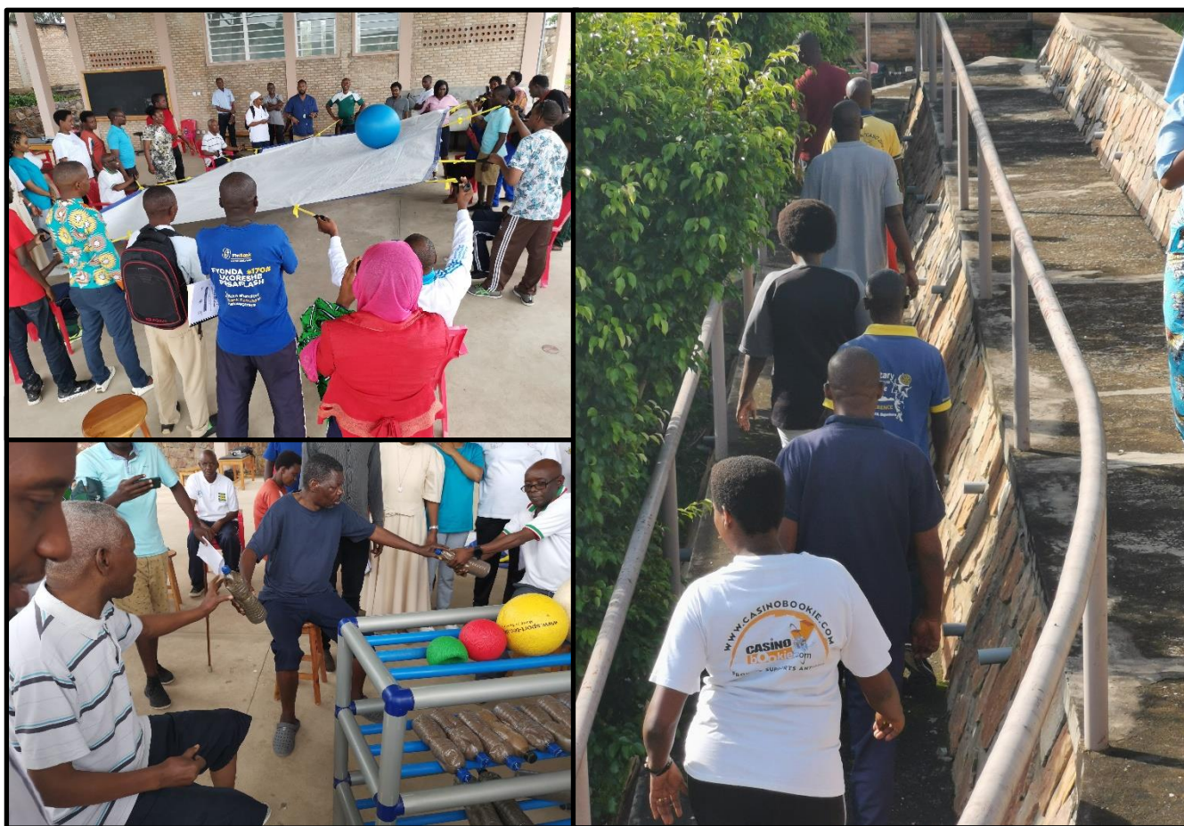
Photos n° 4: Démonstration de la thérapie collective sur les patients invités