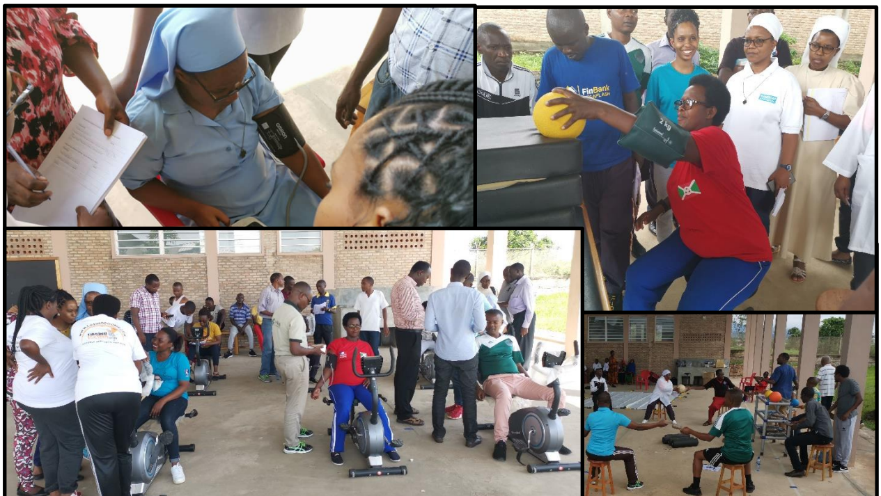
Photo n°3 : Démonstration pratique de l'évaluation et des thérapies entre les participants

Pour bien assimiler les informations reçues en théorie, les formateurs ont démontré les différentes techniques d'évaluation et les différentes thérapies basées sur l'activité physique intensive et collective. Les participants ont fait des démonstrations entre eux avant de débiter la pratique de ces thérapies sur les patients.