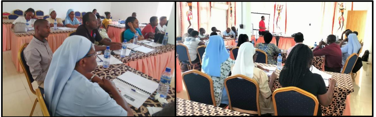
Photos n°2 : Participants dans la salle de formation à l'hôtel la perle